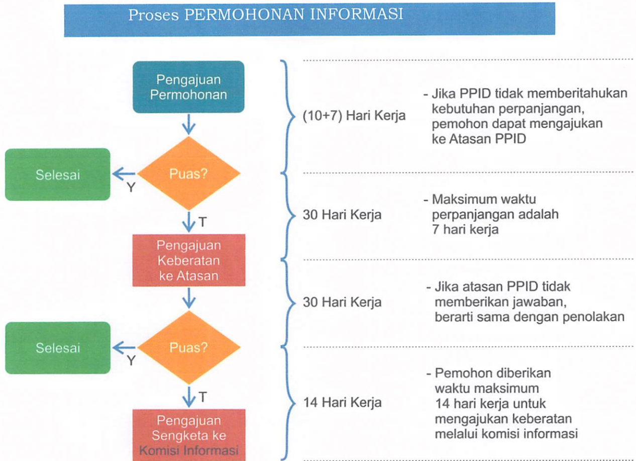
Gambar :2.1 Proses Permohonan Informasi