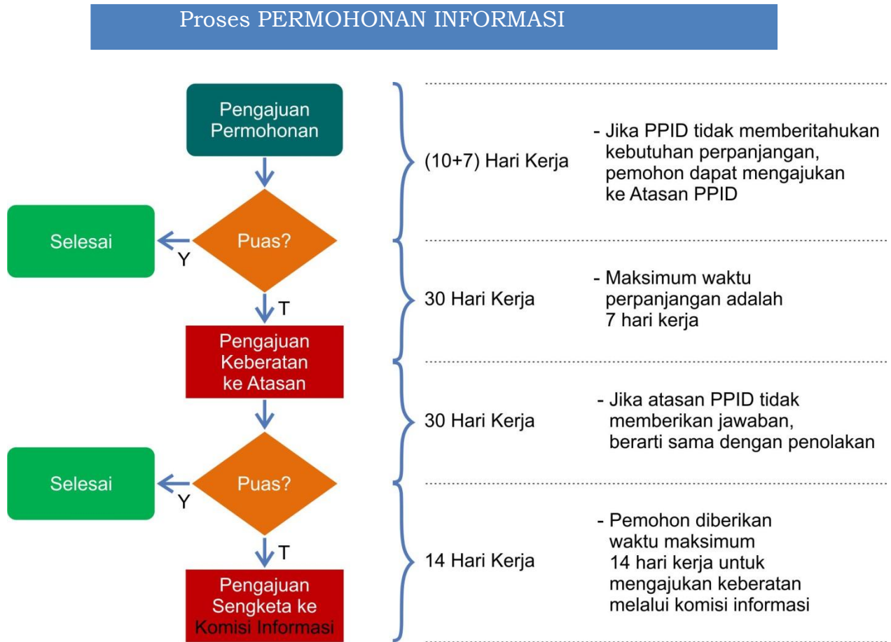
Gambar :2.1 Proses Permohonan Informasi