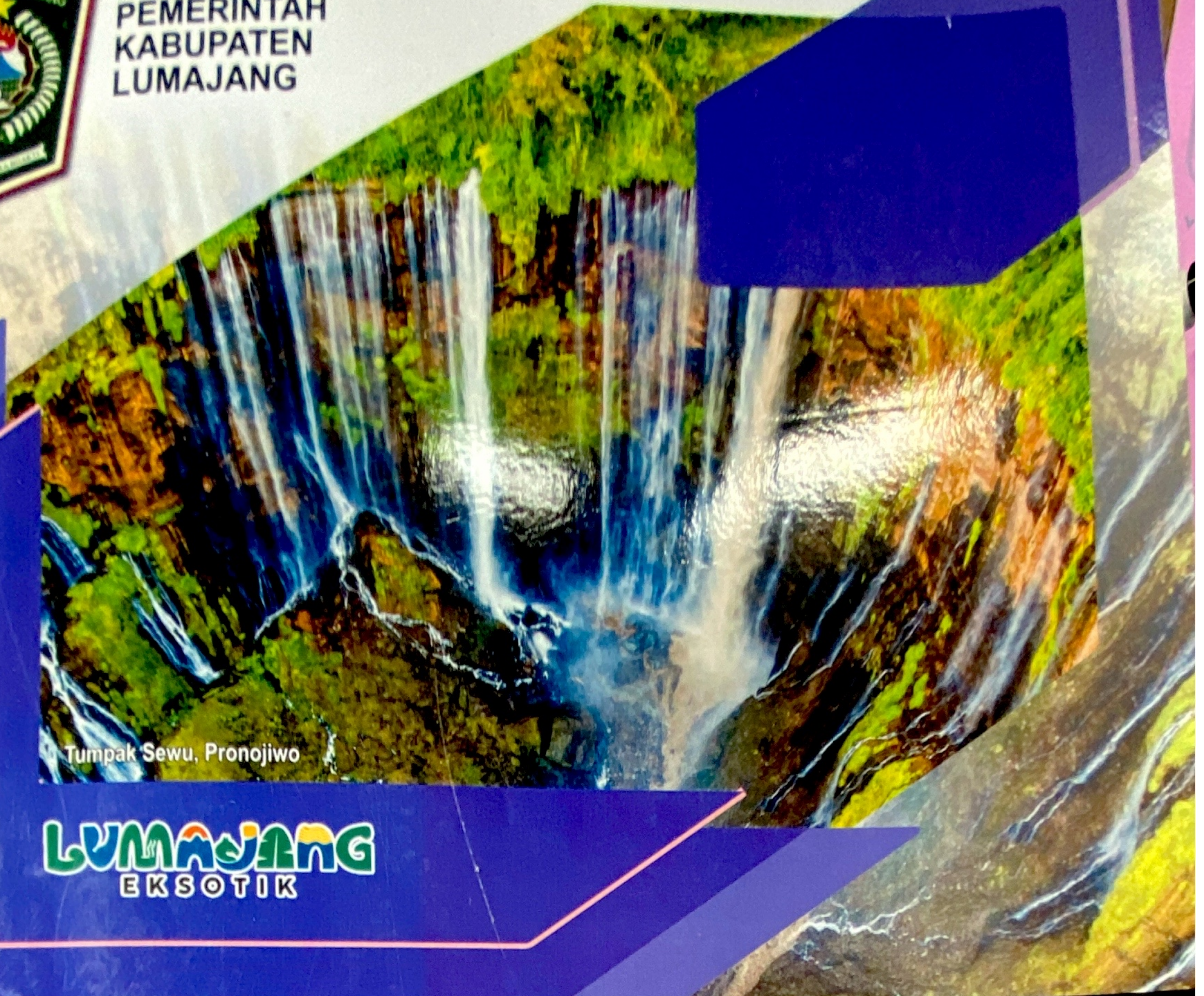
Tumpak Sewu, Pronojiwo